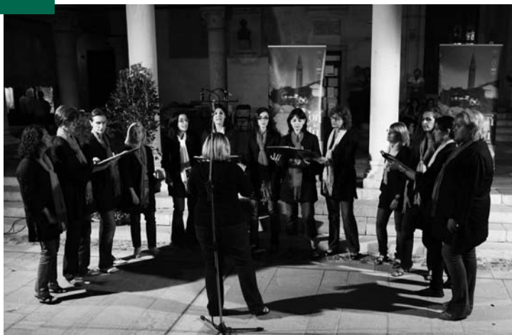
Cori in Festa 2009, Coro Simple Voices

all'insegna della valorizzazione della coralità amatoriale.