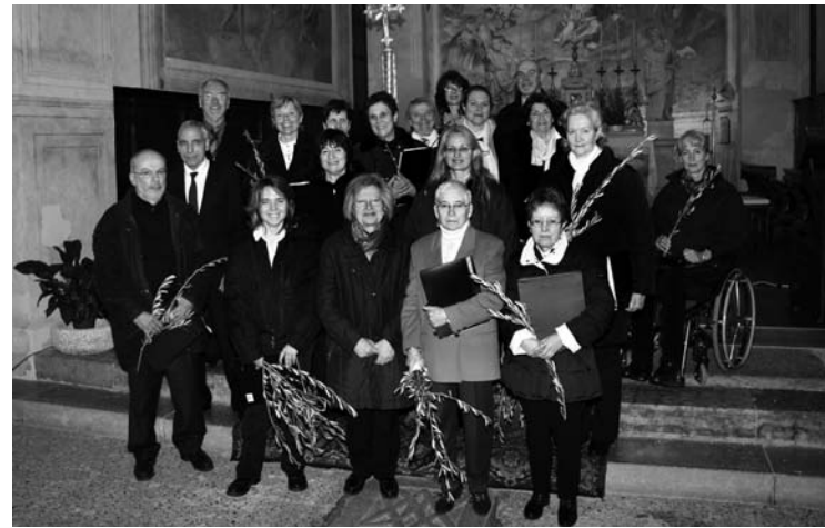
"Amici canto gregoriano"

bontà e ricchezza di questo repertorio, insieme anche alle inevitabili condizioni di limite e di difficoltà, tenendo conto della sua antichità e del suo specifico ethos espressivo.