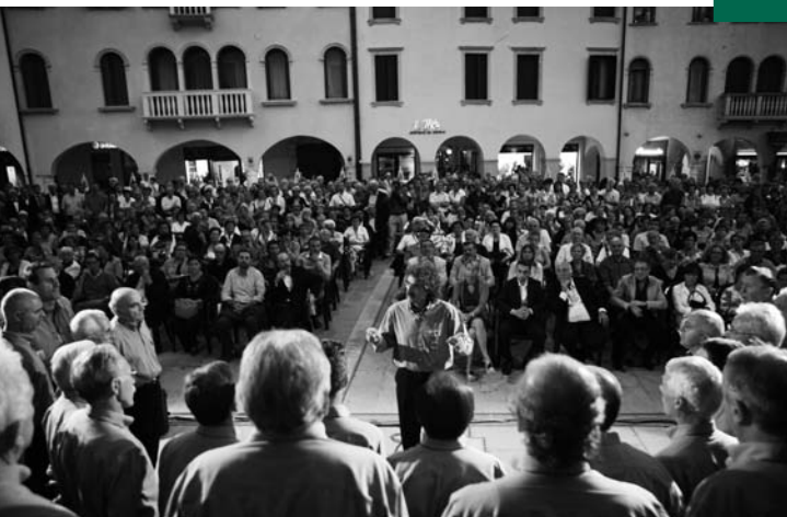
Cori in Festa 2009, Coro Livenza