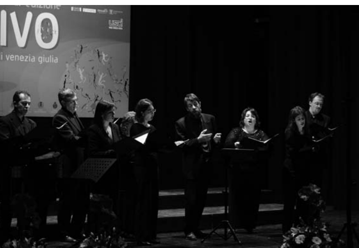
Gruppo vocale Dumblis e Puemas