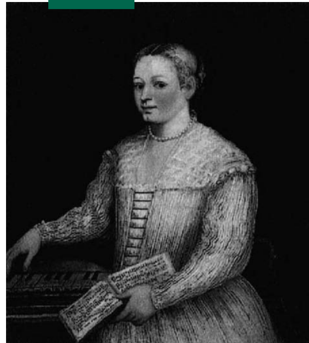
Marietta Robusti, Autoritratto

simbolicamente impiegato per tradurre in immagini significati di natura filosofica e concettuale, evocativi, propagandistici in senso culturale, politico o addirittura religioso. Nelle opere figurative individuate, lista sempre in fieri perché continuano ad accumularsi nuovi materiali da analizzare, è proprio la ricchezza di senso che le musiche dipinte di volta in volta sottendono che ci colpisce per la sua varietà e per la forza comunicativa. Così nello studiolo del duca Federico da Montefeltro ad Urbino campeggiano, sui pannelli di rivestimento delle pareti finemente intarsiati in legno, due spartiti, uno con la celebre chanson francese del XV sec. J'ay prins amours , testo musicato da diversi compositori fiamminghi, come Caron o Busnois, l'altro con una composizione anonima, anche se di recente ipoteticamente attribuita a Johannes Tinctoris, Bella Gerit . Nella prima trova espressione la raffinata cultura e il profondo interesse nei confronti della musica del suo tempo del Duca, nella seconda l'encomiastica esaltazione delle sue prodezze di condottiero. Molte sono le tematiche che gli artisti del periodo hanno voluto comunicare al loro tempo, da quello del concerto come riflesso dell'armonia cosmica o addirittura come manifesto propagandistico delle nuove teorie musicali delle avanguardie seicentesche nei quadri di Caravaggio, all'uso dello spartito dipinto con una