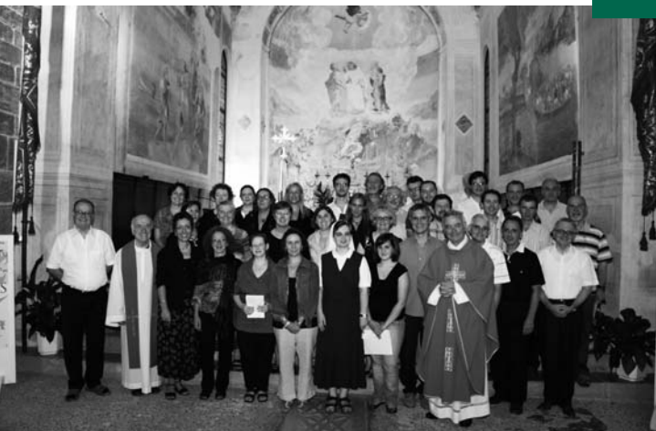
I corsisti a Rosazzo