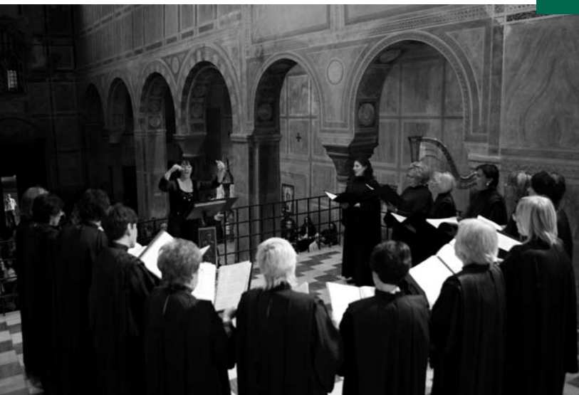
Polifonia 2009, Ancelle di Erato