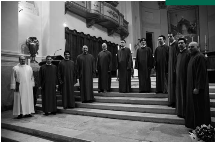
Schola gregoriana "Scriptoria"