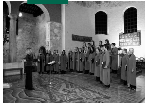
Il Domina a Grado

Vi stanno già lavorando infatti i dirigenti del "Monteverdi" che vogliono celebrare l'anniversario del decennale in grande stile, apportando anche significative innovazioni al regolamento della manifestazione. Saranno probabilmente invitate anche alcune corali italiane di prestigio, che in questi ultimi anni hanno fatto richiesta di partecipazione, sarà senz'altro un grande e importante evento culturale.