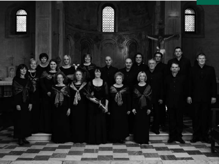
Polifonia 2009, S. Antonio Abate