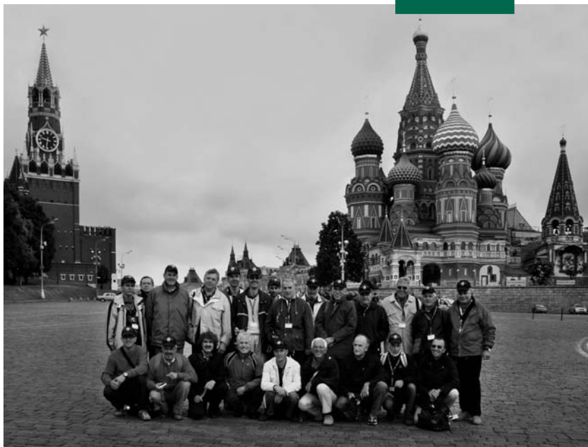
Il Coro Livenza in Piazza Rossa

tutti gli ufficiali in alta uniforme e in un importante centro culturale alla periferia di Mosca.