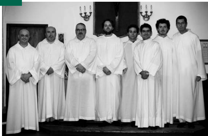
Schola Gregoriana "Rodigium"

theos , ecc) e latini (tutti gli altri); per lo stile, accanto alle melodie sillabiche e semisillabiche dell' ordinarium e della salmodia, si afferma e si impone l'andamento melismatico e ornato di tractus , graduale , alleluia ecc.