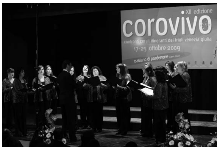
Gruppo vocale femminile Jezero