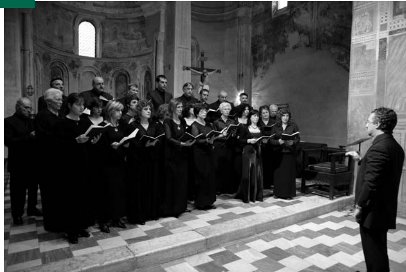
Polifonia 2009, Montereale