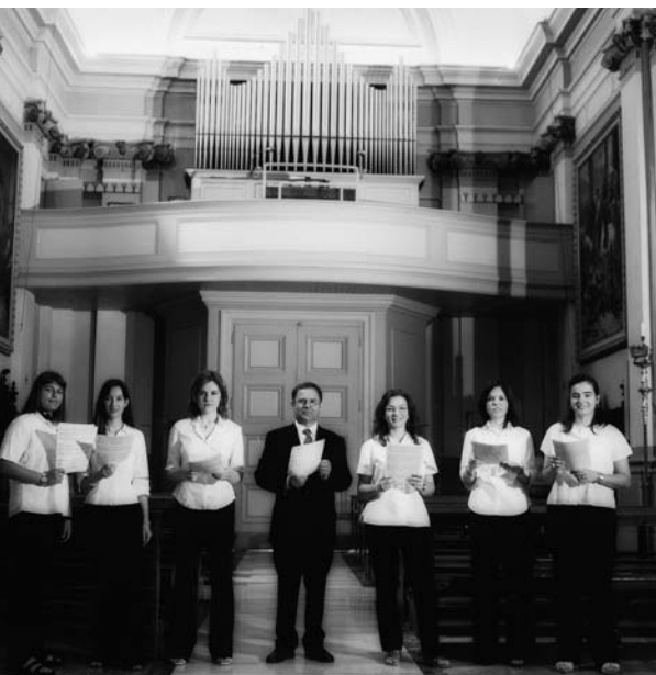
Gruppo vocale femminile "Euterpe"

celebrante, gli altri vari ministri liturgici, la schola con il suo direttore e anche altri musicisti che contribuiscono a sostenere e qualificare l'iniziativa. C'è bisogno di molta passione, condita di umiltà e determinazione e non priva della giusta spiritualità. Bisogna tornare (sempre) a scuola di canto. Per reggere in modo maturo la proposta di elementi di canto gregoriano, occorre formarsi una coscienza critica dal fenomeno artistico, studiato, almeno per i diretti esecutori e animatori, con