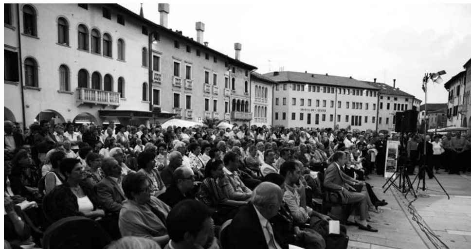
Cori in Festa 2009, Piazza

Nel pomeriggio 12 concerti hanno presentato l'ampia offerta culturale della nostra coralità nelle chiese, teatri, palazzi e piazze della città di Sacile, sottolineando il connubio cultura/territorio che da sempre l'USCI Pordenone promuove