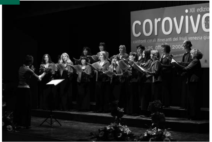
Coro femminile Clara Schumann