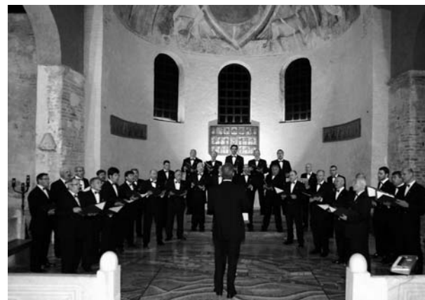
Il Monteverdi a Grado