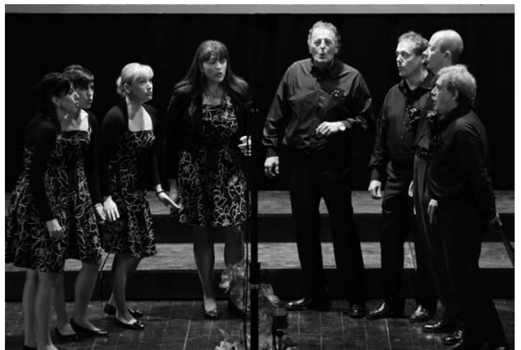
Gruppo vocale Ansibs