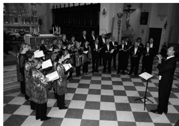
Kantila a Pordenone